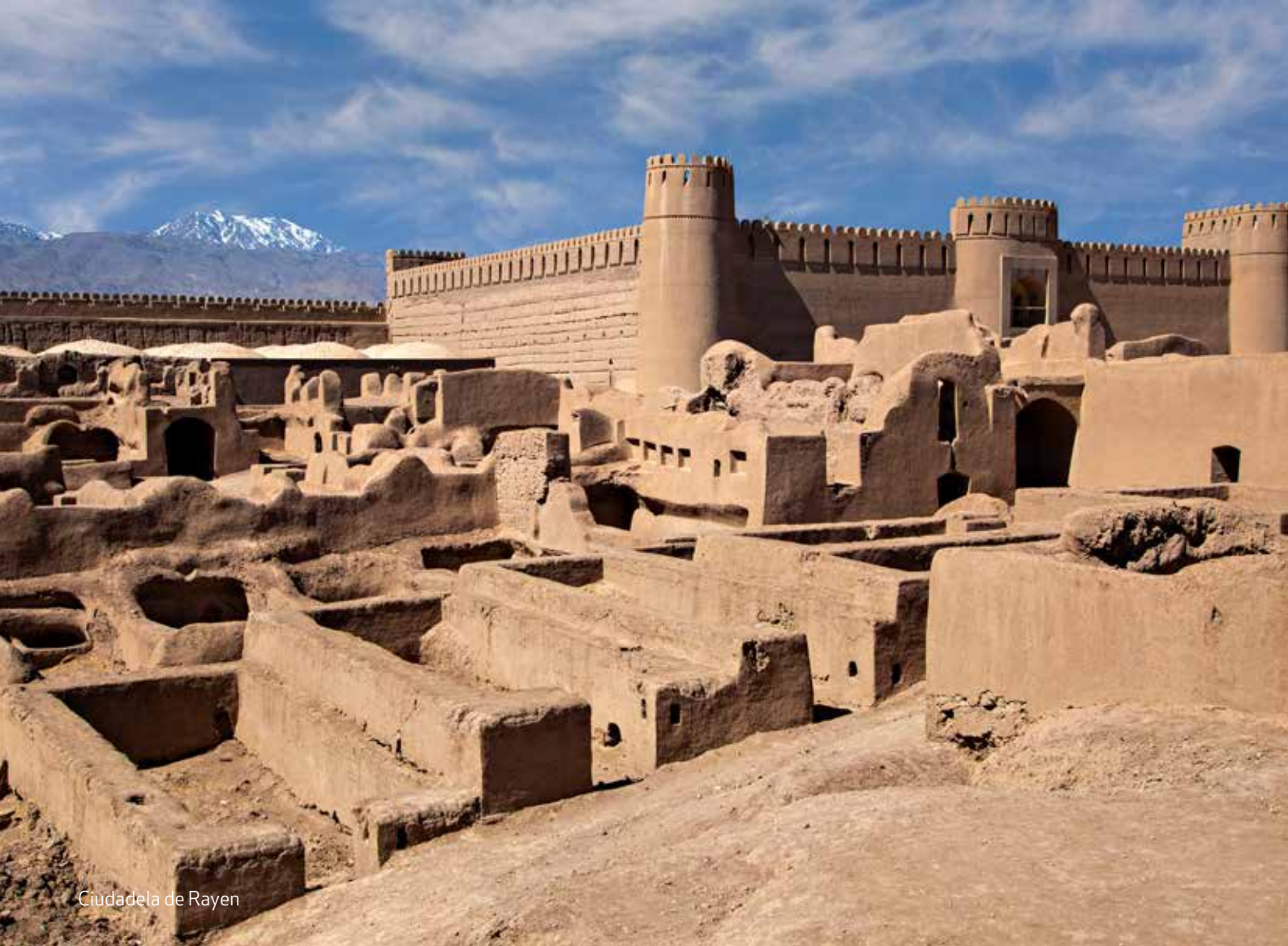
Ciudadela de Rayen

rato allí y lo exploraremos tranquilamente. Por la tarde volvemos a Qeshm. Almuerzo en restaurante local durante la excursión. Traslado al hotel. Alojamiento.