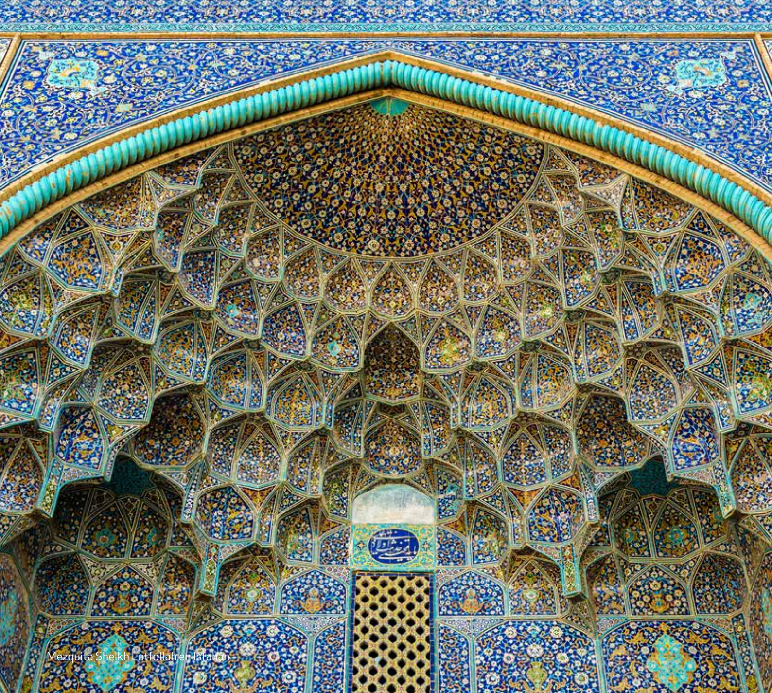
Mezquita Sheikh Lotfollah en Isfahán