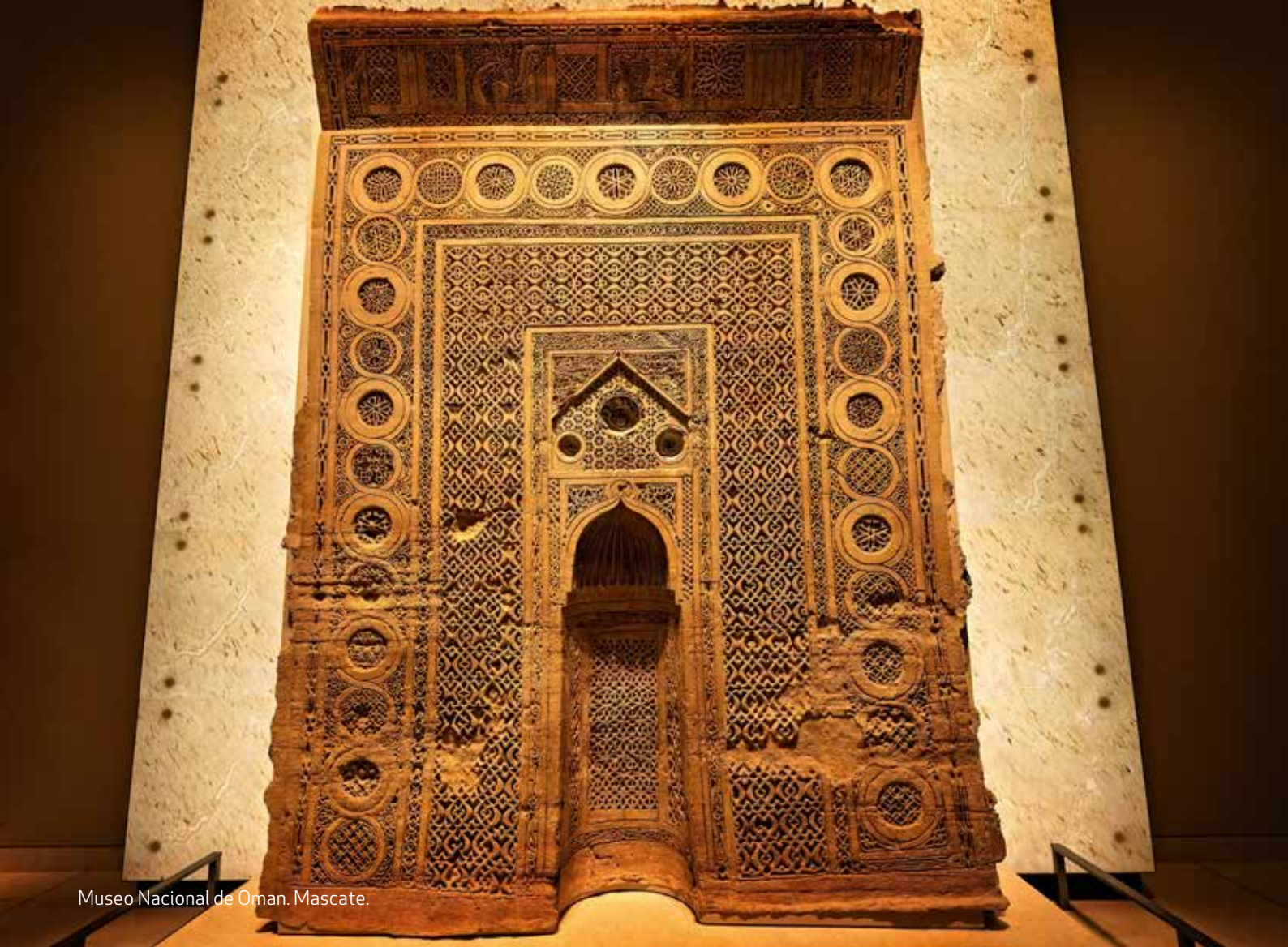
Museo Nacional de Oman. Mascate.

del arte del Islam, el Este y Europa y una colección de instrumentos extraordinarios. (Sábado a Jueves, de 8:30 AM a 5:30 PM).